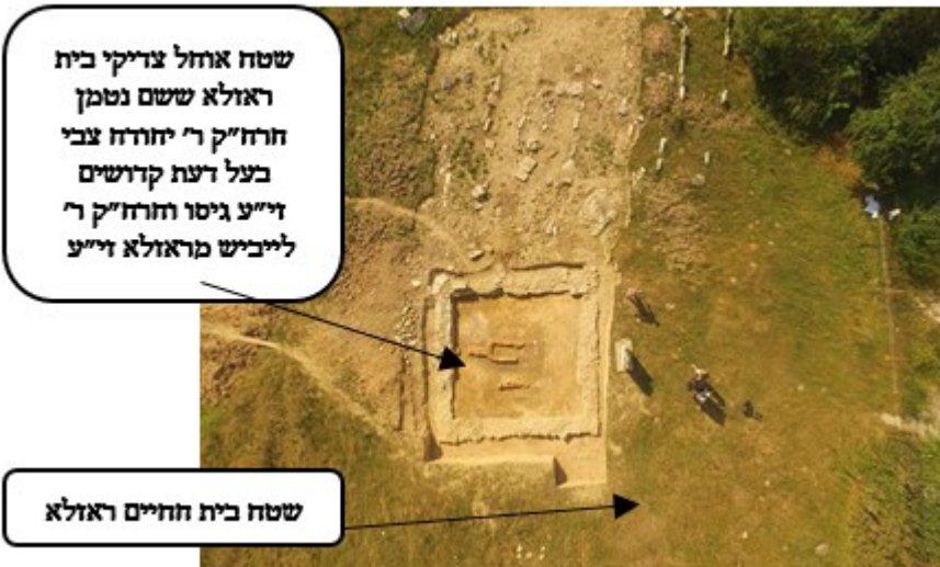
צבי מראזלל ורוב חסידיו זידיטשוב קבלו מרותו עליהם.

אחרי הסתלקות הרה"ק רבי צבי מזידיטשוב זי"א תמוז שנת תקל"א נסעו החסידים לאחיו הרה"ק רבי ישכר בעריש אבל לא ארכו הימים כי עלה השמימה כעשרה ירחים אחרי פטירת אחיו ביום ד' חג השבועות תקל"ב, ואז נסעו החסידים לאחיו הרה"ק רבי משה מסאמבור, בו אייר שנת ת"ר נסתלק הרה"ק רבי משה מסאמבור, עבר ההנהגה לבנו ה"ה רבינו הרה"ק רבי יודא