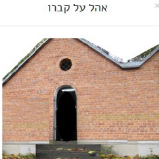
אהל על קברו

רבינו היה איש חלקים קדוש, בעל מקובל גדול ונורא, בויניא קדישא, חסידא ופרישא, אלפי חסידים נהרו אליו כי היה מפורסם לבעל עבודה גדולה ולבעל רוח הקודש אמתי, וכל דבר שיצא ממנו לא שב ריקס, אפילו גדולי דודו היה כפופים לו ודפקו על פתחו.