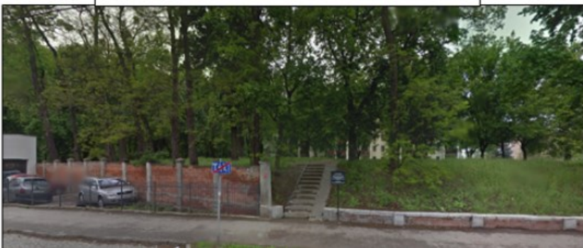
שטח בית החיים בטהארן מנו"כ של רבינו זי"ע