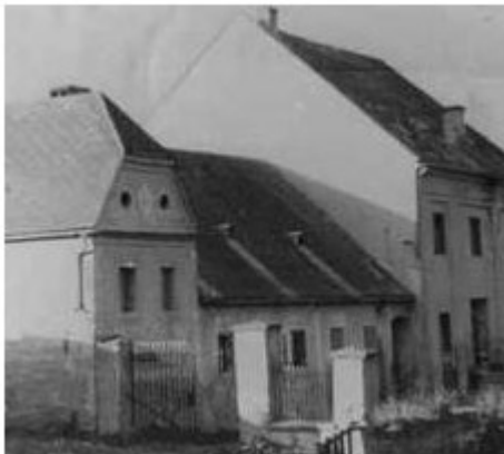
בעל אור חדש

רבינו בעוד היה נער כבר מילא כריחו מש"ס ופוסקים, והי' לרשן נפלא, ונבחר לאב"ד בצלולאווא, והוליא לאור בשנת תקכ"ו לרשותיו ביחד עם ספר כתנות אור על תרי"ג מצוות מזקנו הגה"ק בעל פנים מאירות זי"ע,