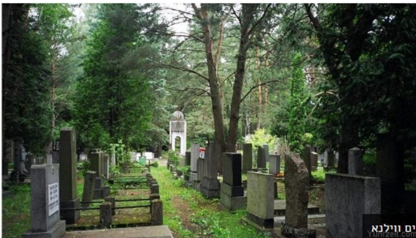
בית החיים ווילנא

בא ודורש ממך להוציא אותי מן הקבר כדי לאשר את תשלום חובותיו? ובכן סיים רבינו: תודה לה' אני חי יושב ועוסק בתורה, אנה אל נא תטרידי אותי בעניני המסחר. ביאוש חזרה האשה אל בית המסחר שם המתין הש"ר ומסרה לו את סירובו של בעלה. תשובה זו מצאה חן בעיני הש"ר ששלם את חובו כש הוא מוכן להסתפק בחתימת ידה.