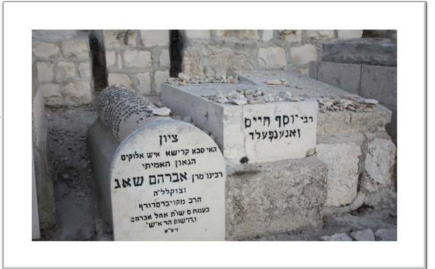
מתורתו של רבינו