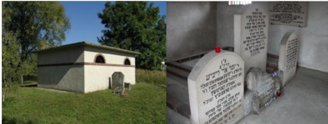
אהל ומצבת רבינו