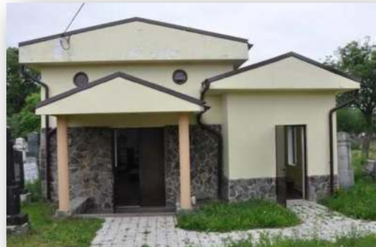
על פני הגנה, שבו ראו לטובלה, כי חותנו כבר הקלימו.