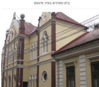
בית המדרש בעיר סיגעט

מקבלים עליהם חיובי לשמור ולעשות ולקיים. הגיעו הדברים עד כדי כך, שמיד במוס"ק כשנכנס רבינו לחדרו הפרטי אחר הבדלה, שבו היה מקבל את החסידים ביחידות לענה ולברכה, והבין את עצמו לקבל את פניהם שבאו ממרחק להסתופף בזילו בשב"ק, החפצים להיפרד ולקבל את ברכת הקודש וגעזעגענען בטרם לאתם לזרעם, האומין וחיכה עוד ועוד והגה אין איש נכנס. קרא רבינו לבנו הרה"ק בעל קדושת יו"ט זי"ע והביע בפניו את פליאתו, איך האנשים אשר באו אליו לשבת, מפני מה אינם באים לטובל את ברכת הדרך בטרם לאתם לזרעם? ואף כיוה עליו להכנס להיכיל ביהמ"ד לתור אחרי האורחים ולברר פשר הדבר. נכנס הקדושת יו"ט לבית המדרש, והנה כולם