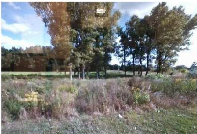
שטח הבית החיים

בשנת תרמ"ה נתקבל כאב"ד בעיר סולעיאוו, וכעבור כמה שנים איוה למושב לו בעיר ראספשא