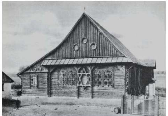
בית המדרש בעיר פשעוורז

שהאמונה מחזקת אף בזמן בגלות המר הזה בקהל קדושים בעם בני ישראל.