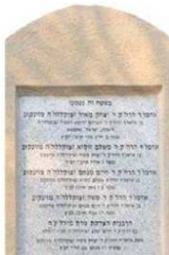
דברי שיר ותליצ'ה הזה כתוב רבינו להקדמתו לספר זקני אהב ישראל השיר חסיד על עשר ספירת הירועות בקבלה. ובראשי וסופי התרוזים מרוממים שמו, שם אביו, שם זקנו זי"ע

שיר לכבוד המוכר רודל בראי כ יא לאר פופתי - לולות שעות בריקול - לימים סור וקין וול - ארור אלהים ש יסד קול תהל - קול חייב תעבו עשי ספיותני - לו סודני יחייב (ה) קול עש הסבת קין - (ה) קול עש אה קין (ה) קול עש הסבת קין מול עש וסיה ספיות פופתי סל סותקני כיל סיה ספיות אמר שישלמוספסהספיעתני ם יצאו אד תודן מן רודל ם אר השיר לכל באי קול ם כיון וכסו וסוה סתנוסני ע ע"י יסיה חרוד סוה ער ע ודולות סוה סוה סיה סוה ע רודל כסו סוה יל ל קובסו חוקקו סוה סוה יל ל וכל סוה סוה סוה סוה ל וסיה סוה סוה סוה סוה סוה סוה סוה סוה סוה סוה סוה סוה סוה סוה ס סוה סוה סוה סוה סוה סוה סוה סוה סוה סוה סוה סוה סוה סוה סוה ס סוה סוה סוה סוה סוה סוה סוה סוה סוה סוה סוה סוה סוה סוה סוה ס סוה סוה סוה סוה סוה סוה סוה סוה סוה סוה סוה סוה סוה סוה סוה ס סוה סוה סוה סוה סוה סוה סוה סוה סוה סוה סוה סוה סוה סוה סוה ס סוה סוה סוה סוה סוה סוה סוה סוה סוה סוה סוה סוה סוה סוה סוה ס סוה סוה סוה סוה סוה סוה סוה סוה סוה סוה סוה סוה סוה סוה סוה ס סוה סוה סוה סוה סוה סוה סוה סוה סוה סוה סוה סוה סוה סוה סוה ס סוה סוה סוה סוה סוה סוה סוה סוה סוה סוה סוה סוה סוה סוה סוה ס סוה סוה סוה סוה סוה סוה סוה סוה סוה סוה סוה סוה סוה סוה סוה ס