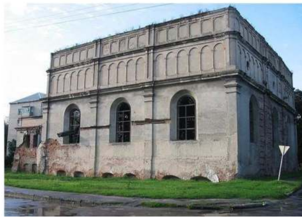
די אלטע שול אין בראד