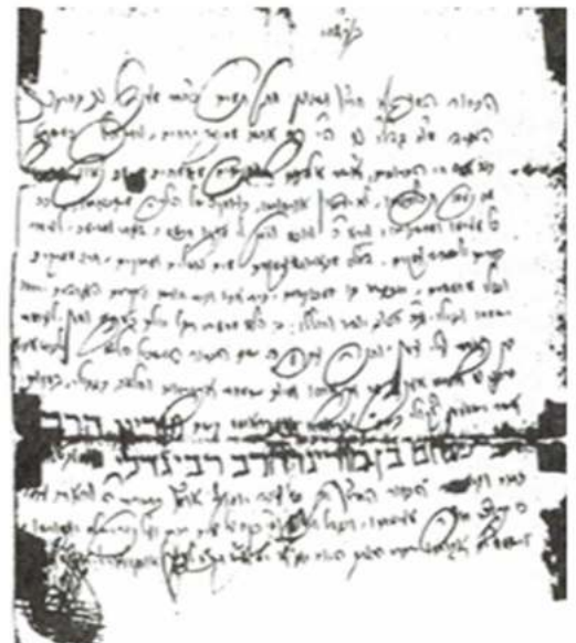
תעודה לרבינו מרבו הגה"ק מהר"ם א"ש זי"ע